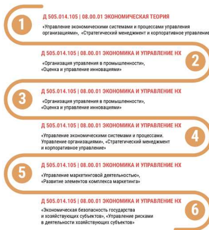
Рисунок 2 – Диссертационные советы Финансового университета при Правительстве РФ: специальность, профили

Многие диссертационные советы помимо специальности имеют свой профиль. При поступлении вы должны учитывать этот момент. Важно не просто выбрать диссертационный совет, но и его профиль (рис. 2). Особенно тщательно нужно искать «свой» диссовет, если у вас уже есть тема научного исследования. Если проблематика будущей диссертации не входит в профиль диссовета, вас, скорее всего, попросят сменить диссовет или тему вашей работы.